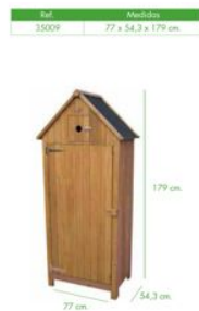
Armario Génova (35009) (Cañizos Faura)