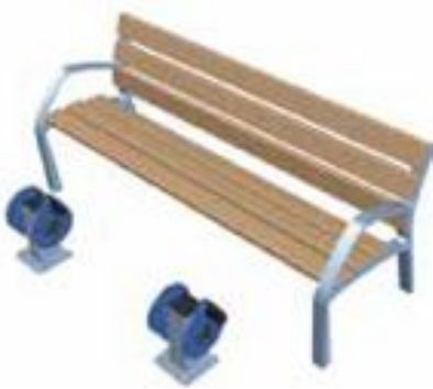
Banco de pedales modelo GA12 (Galopín)