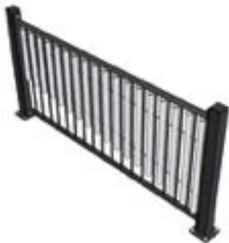
Valla musical modelo VAM01 (Galopín)