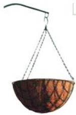
Maceteros colgantes de fibra de coco (30261) (Cañizos Faura)