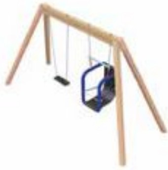
Columpio rústico accesible modelo L601i (Galopín)