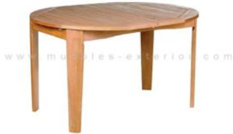
Mesa de madera ampliable (Muebles-exterior)