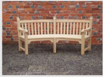
Banco semicircular (Garden & Patio)