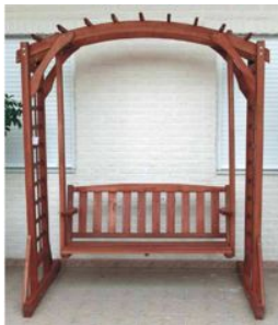
Pérgola tropical con balancín (80100) (Cañizos Faura)